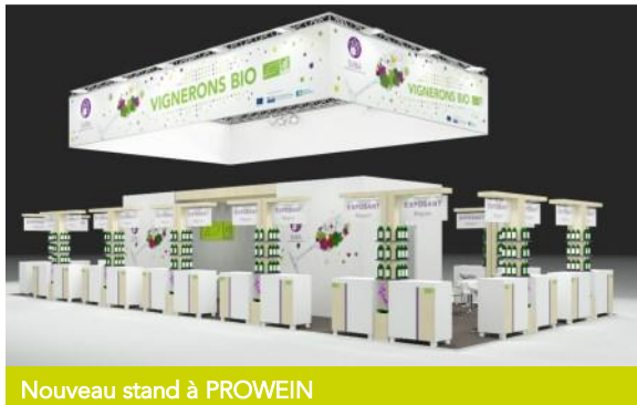
Nouveau stand à PROWEIN