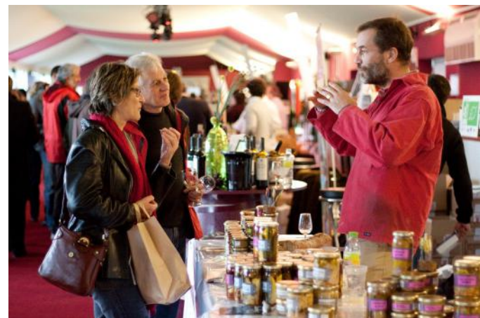
Marché Gourmand des Vins Bio

Réflexion Circuit court en partenariat avec le réseau FRAB