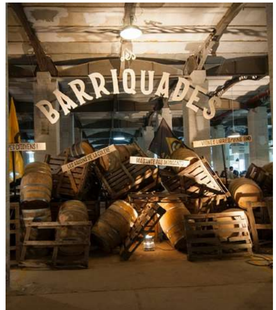
Les Barriquades Marché Gourmand des Vins Bio

Mise en place d' ambassadeurs Bio pour assurer la bonne représentation des vins bio dans le cadre des partenariats